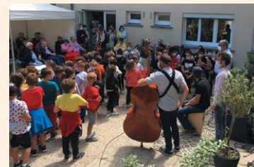
Représentation musicale des élèves avec le groupe Norkito à la maison de retraite

Récolter les moyens de faire vivre aux enfants des moments inoubliables et des expériences enrichissantes : voilà l'objectif de l'Amicale Laïque (l'association des parents d'élèves de l'école Maupas). Pour ce faire, rien de tels que des moments conviviaux, des manifestations comme le marché de Noël ou Percynéma, et des actions de ventes (fromage de montagne, plantes, chocolat, etc) qui sont autant d'opportunités pour échanger, mieux se connaître, s'investir selon ses propres moyens et partager de belles expériences. L'Amicale Laïque est une association dynamique, qui s'engage jour après jour pour concrétiser l'enthousiasme et l'imagination de notre belle équipe.